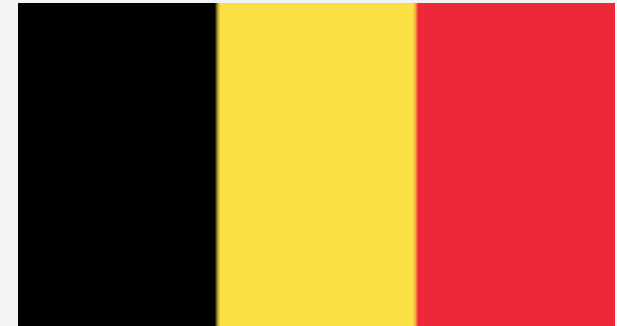
GO! School voor Buitengewoon Secundair Onderwijs t Vurstjen