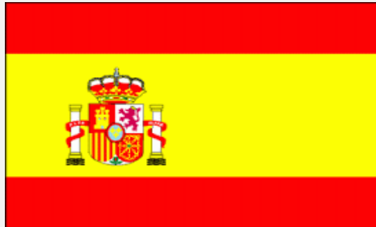
CEIP "Fray Juan De La Cruz,,