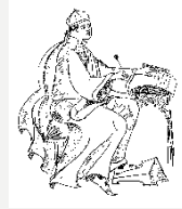
CEIP Arcipreste de Hita