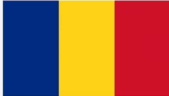
Scoala Gimnaziala Speciala SF NICOLAE